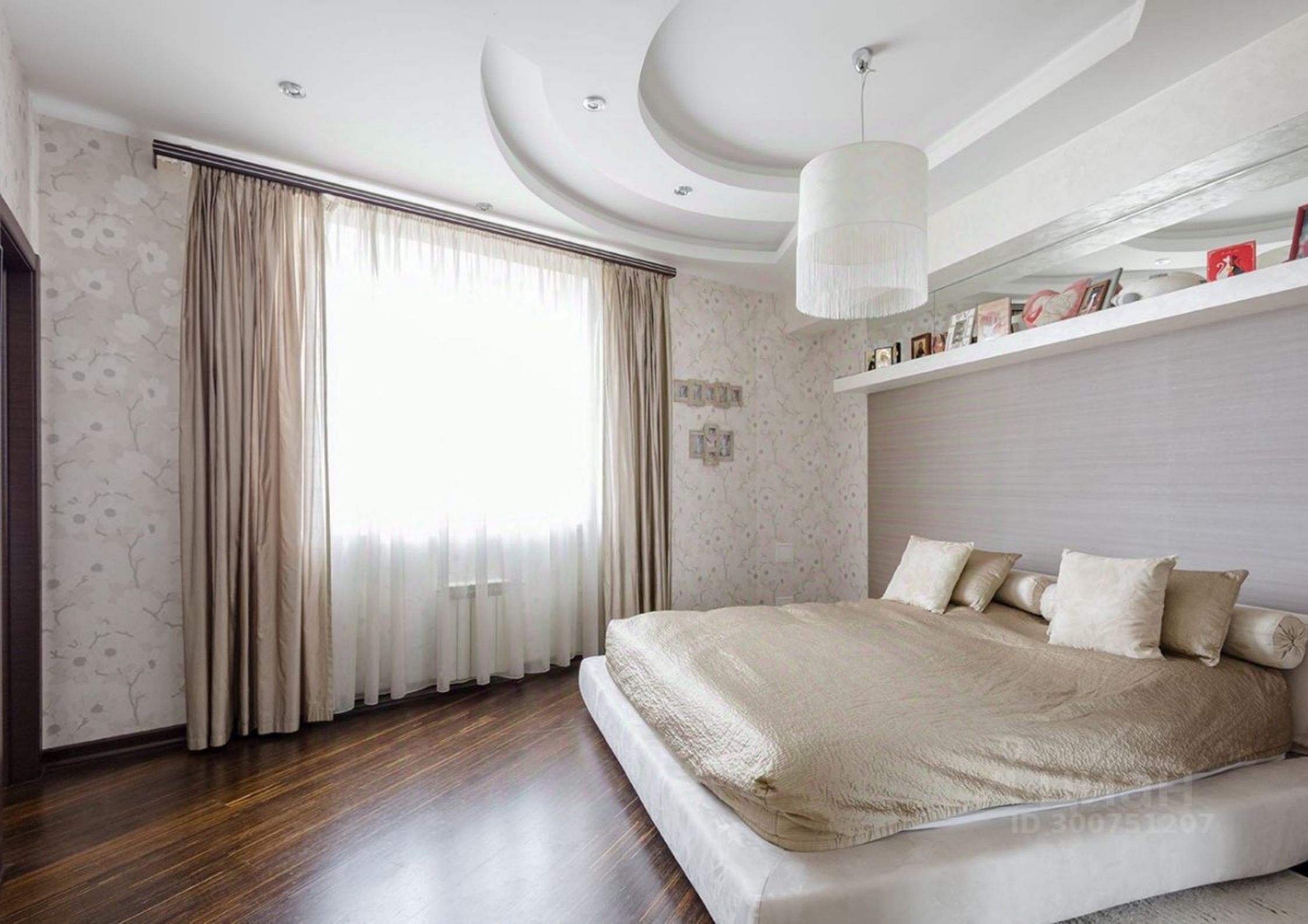
PHOTO ID 300751207